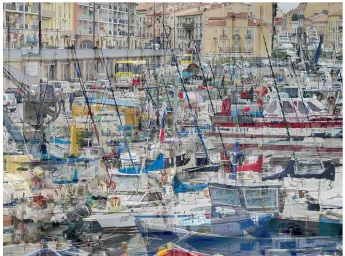
Sète n°8, C-Print, 125 x 167 cm , Ed.: 5

galerie@galeriekornfeld.com www.galeriekornfeld.com https://www.facebook.com/kornfeldgalerie/